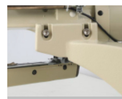
Ajuste de altura de cabeçote