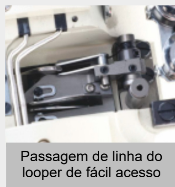
Passagem de linha do looper de fácil acesso