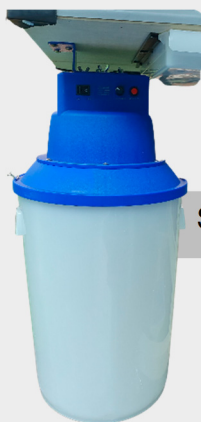
Sucção de resíduos